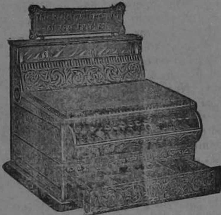
Para pormenores oídese á MACAYA Y Ca. — UNICOS AGENTES San José de Costa Rica

Todo aparato está garantizado y su precio relativamente equitativo recomienda su compra.